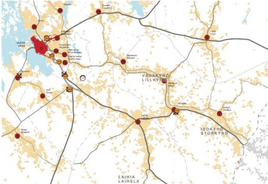
Ote Pohjanmaan 1. Vaihemaakuntakaavasta 4.10.2013.