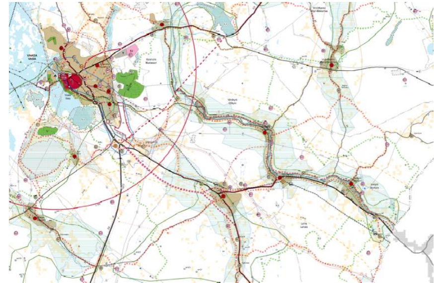
Ote Pohjanmaan maakuntakaavasta 21.12.2010.

Maakuntakaava ohjaa kuntien laatimia yleis- ja asemakaavoja, joissa päätökset koskevat alueidenkäytön ja yhdyskuntarakenteen yksityiskohtia. Ympäristöministeriö on vahvistanut Pohjanmaan maakuntakaavan 21.12.2010.